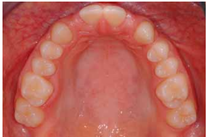
Abb. 5 Intraorale, okklusale Ausgangssituation