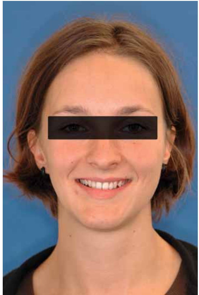
Abb. 23 Porträtaufnahme, neun Monate nach Inkorporation der Arbeiten

Das Arbeitsfeld wird mit Kofferdam isoliert, das Gerüst korndgestrahlt ( \text{Al}_2\text{O}_3 , 50 \mu\text{m} , 2,5 bar) und abgedampft. Der Schmelz wird säuregeätzt und die Rekonstruktionen mit einem rein chemisch härtenden Befestigungskomposit auf MDP-Basis (Panavia™ 21 TC) eingegliedert.