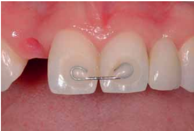
Abb. 22 Evaluation vor Inkorporation: keine wesentliche Beeinflussung der Zahnfarbe