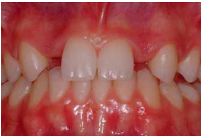
Abb. 4 Intraorale, frontale Ausgangssituation