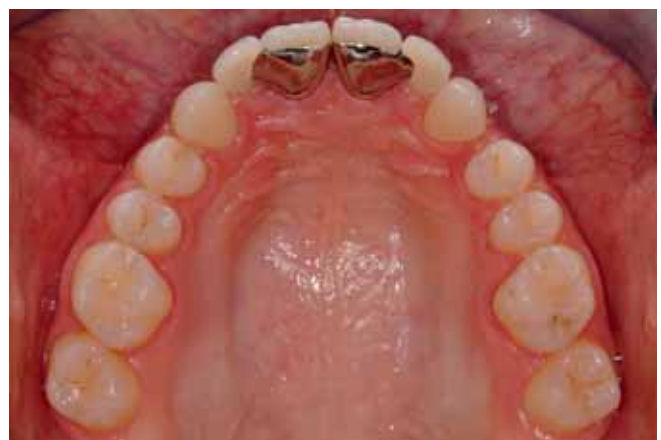
Abb. 24 Okklusalanzeige, neun Monate nach Inkorporation der Arbeiten

Der Wunsch, ein Lückenschluss in der Oberkieferfront ohne erneute kieferorthopädische Behandlung, konnte mit dem vorgestellten Vorgehen effizient, kontrolliert und zur vollen Zufriedenheit der Patientin realisiert werden.