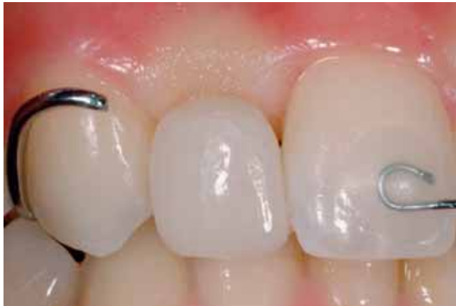
Abb. 16 Zwischengliedbereich in Regio 12 unmittelbar nach Auftragen von Komposit. Man beachte die Ischämie.