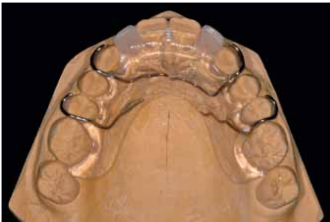
Abb. 12 Retentionsschiene auf dem Modell