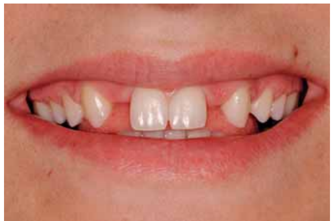
Abb. 7 Lippenbild mit maximalem Lachen bei Behandlungsbeginn

nach rechts eine Führung des Zahnes 13 mit Beteiligung der Zähne 14 und 16. Als Folge der beinahe dauernd getragenen Retentionsschiene findet sich in der maximalen Interkuspitation ein Overjet von ca. 0,5 mm zwischen den zentralen Oberkiefer- und Unterkieferfrontzähnen (Abb. 6).