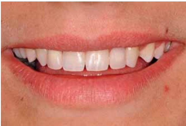
Abb. 11 Lippenbild lachend mit Setup