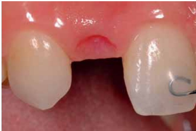
Abb. 17 Abgeschlossene Pontic-Konditionierung in Regio 12