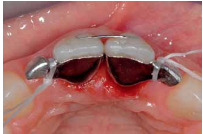
Abb. 20 Gerüsteinprobe von okkusal