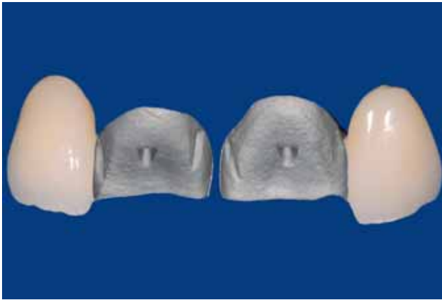
Abb. 21 Fertigestellte Adhäsivbrücken von bukkal