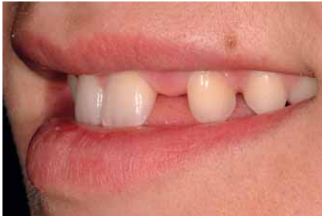
Abb. 8 Schräglaterales Lippenbild links bei Behandlungsbeginn