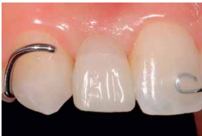
Abb. 18 Abgeschlossene Pontic-Konditionierung in Regio 12 mit eingesetzter Retentionsschiene

durchgeführt (Parallel-A-Prep™), wobei dieser anspruchsvolle Schritt vorgängig auf dem Gipsmodell diagnostisch durchgespielt wird. Dabei kann die ideale Einschubrichtung definiert und fixiert werden. Diese wird in etwa parallel zur Bukkalfläche des Pfeilerzahnese gewählt (Abb. 19). Damit wird gewährleistet, dass das Gerüst palatinal nicht zu weit nach inzisal extendiert werden muss und dort zu einem grauen Durchschimmern in dieser ästhetisch heiklen Zone führt. Die Präparationen werden intraoral umgesetzt, wobei vorgängig unter Lokalanästhesie