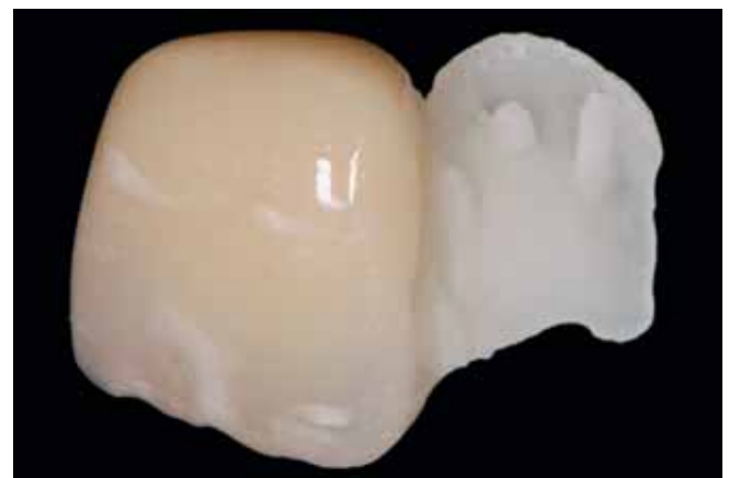
Abb. 2 Einflügelige, vollkeramische Adhäsivbrücke

Parallel zur Entwicklung in der konventionellen, festsitzenden Rekonstruktiven Zahnmedizin haben Faktoren wie verbesserte Ästhetik (kein graues Durchschimmern von Gerüstanteilen), Metallfreiheit sowie Biokompatibilität zu einer Bevorzugung von vollkeramischen Adhäsivbrücken geführt (Abb. 2, KERN ET AL. 1991). Dabei kamen unterschiedliche Keramiksyste-me zum Einsatz. Anfänglich wurde glasinfiltrierte Aluminiumoxidkeramik mit der Schlickertechnik (KERN ET AL. 1991) und im Kopierfräsv erfahren eingesetzt (KERN & GLÄSER 1997), später Zirconia-verstärkte Infiltrationskeramik (KERN 2005), pressbare Glaskeramiken (RIES ET AL. 2006) und CAD-CAM-gefertigte Zirconiumdioxidgerüste (HOLT & DRAKE 2008, DUARTE ET AL. 2009).