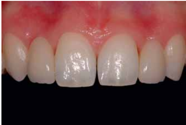
Abb. 25 Frontalansicht, neun Monate nach Inkorporation der Arbeiten