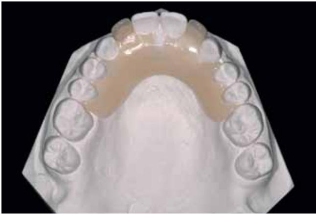
Abb. 10 Diagnostisches Setup auf dem Modell