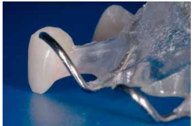
Abb. 14 Basale Gestaltung des Ersatzzahnes nach Pontic-Konditionierung