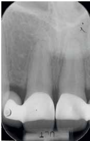
Abb. 26 Abschluss-Röntgenbild der Pfeilerzähne 11 und 21

von Adhäsivbrücken im Oberkiefer-Frontzahnbereich wird zur Ausformung der Zwischengliedauflage die Anwendung von Elektrochirurgie beschrieben (RIES 2003, ELDER & DJEMAL 2008). Nach der elektrochirurgischen Ausformung muss das geschaffene Volumen aber auch mittels eines Provisoriums (abnehmbar oder feststehend) ausgeformt und stabilisiert werden.