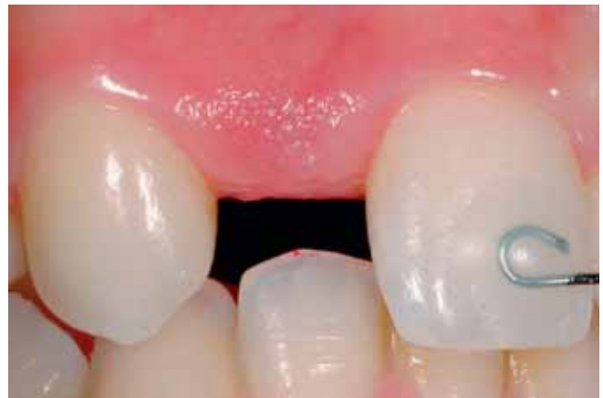
Abb. 15 Zwischengliedbereich in Regio 12 vor Pontic-Konditionierung

dass mit der vorgesehenen Rekonstruktion aufgrund der Achse von Zahn 23 und der Lücke zwischen 23 und 24 gewisse ästhetische Kompromisse akzeptiert werden müssen (Abb. 8). Die diagnostische Präparation der Pfeilerzähne auf dem Modell und die Analyse des diagnostischen Setups im Artikulator in maximaler Interkuspitation und bei Latero- und Protrusion erweisen sich als problemlos.