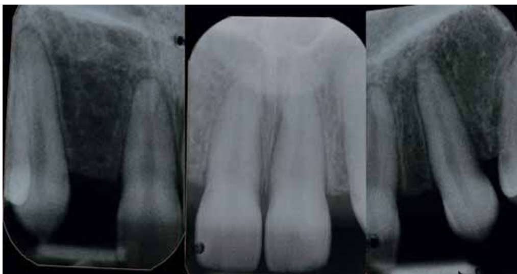
Abb. 9 Röntgenbilder der Oberkieferfrontzähne bei Behandlungsbeginn

Zur Visualisierung des Behandlungszieles und um dessen Realisierbarkeit abzuschätzen, wird vom Zahntechniker ein diagnostisches Zahn-Setup hergestellt und intraoral einprobiert (Abb. 10 und 11). Dabei wird die Patientin darüber informiert,