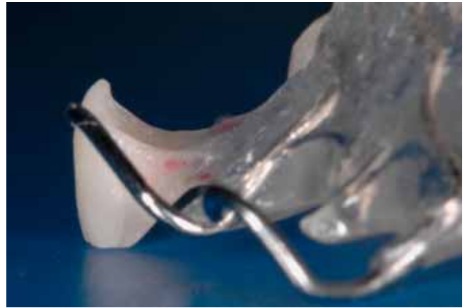
Abb. 13 Basale Gestaltung des Ersatzzahnes vor Pontic-Konditionierung