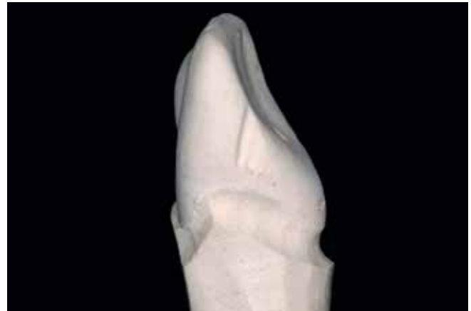
Abb. 19 Gipsstumpf 11 nach Präparation von lateral