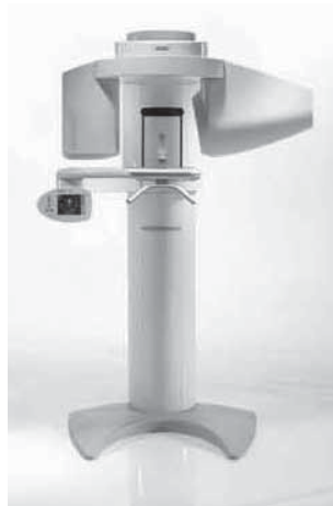
Sirona bietet neue Tools für das 3D-Röntgensystem GALILEOS an.

Die Datenmenge des 3D-Volumens kann nun durch Kompression stark reduziert werden. Dank diesem kleineren Datenvolumen läuft der gesamte Röntgenvorgang – vom Scan bis zur Darstellung des Volumens auf dem Monitor – deutlich schneller ab. Auch die Archivierung ist dadurch vereinfacht. Um die Datenmenge zusätzlich zu reduzieren, kann der Anwender jetzt zwischen zwei Scan-Programmen wählen. Das Programm V01 bietet eine