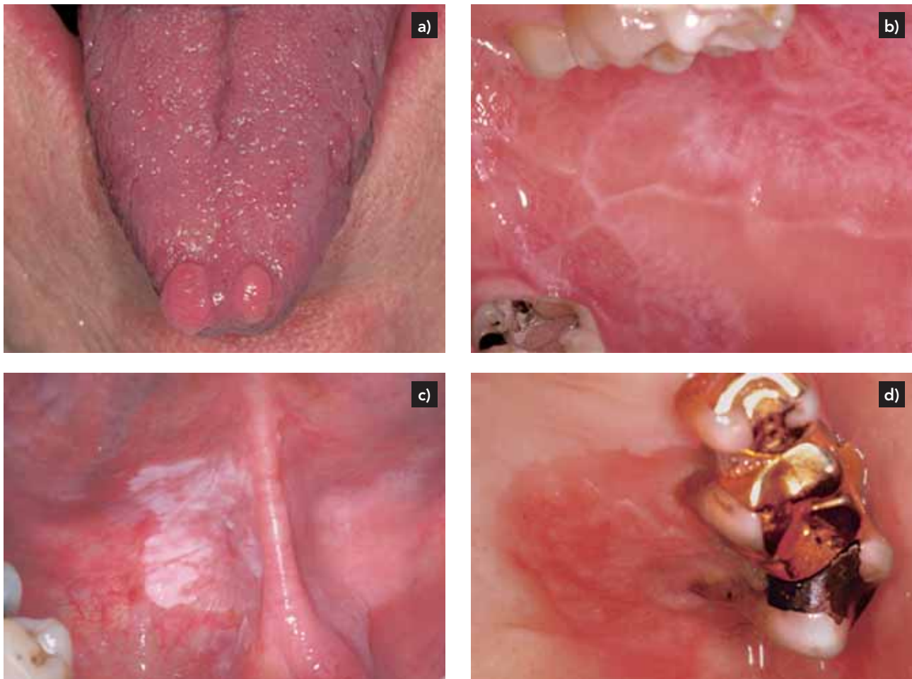
Abb. 1 Spektrum der Mundschleimhautbefunde im untersuchten Patientengut: a) Fibröse Hyperplasien an der Zungenspitze bei einem 51-jährigen Patienten; b) Retikulär-papulärer oraler Lichen planus bei einer 36-jährigen Patientin; c) Homogene Leukoplakie an der Zungenunterseite/am Mundboden rechts bei einem 55-jährigen Patienten; d) Plattenepithelkarzinom des harten Gaumens links bei einem 77-jährigen Patienten