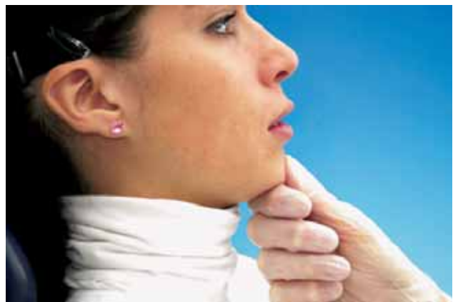
Abb. 4 Alternative Grifftechnik nach ARNE LAURITZEN.

Fig. 3 Technique classique de la prise selon ARNE LAURITZEN: patient assis sur le fauteuil, l'examineur à côté du patient. Index et majeur de la main droite sur le rebord inférieur de la mandibule pour éviter une déviation latérale du maxillaire inférieur. Pouce en appui sur les faces vestibulaires des incisives inférieures. Maxillaires légèrement entrouverts. Par le pouce, l'examineur pousse légèrement la mandibule en direction postérieure et par l'index et majeur légèrement en direction crânienne. La patiente ouvre et ferme par des mouvements de charnière sous le guidage de l'examineur.