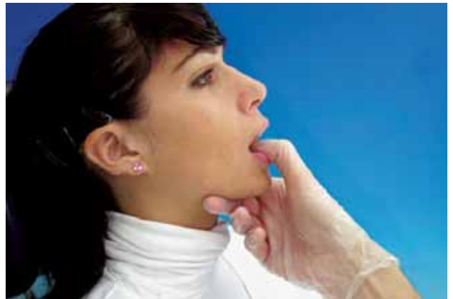
Abb. 3 Klassische Grifftechnik nach ARNE LAURITZEN: Patientin sitzt im Stuhl, Untersucher neben der Patientin. Zeige- und Mittelfinger der rechten Hand des Untersuchers am Untergrund des Unterkiefers zur Vermeidung eines seitlichen Verschiebens des Unterkiefers. Daumen intraoral an den Labialflächen der unteren Schneidezähne, Kiefer leicht geöffnet. Untersucher drückt Unterkiefer mit dem Daumen leicht nach posterior und mit Zeige- und Mittelfinger leicht nach kranial. Patientin öffnet und schliesst in Scharnierbewegungen mit Führung durch den Untersucher.

Fig. 3 Technique classique de la prise selon ARNE LAURITZEN: patient assis sur le fauteuil, l'examineur à côté du patient. Index et majeur de la main droite sur le rebord inférieur de la mandibule pour éviter une déviation latérale du maxillaire inférieur. Pouce en appui sur les faces vestibulaires des incisives inférieures. Maxillaires légèrement entrouverts. Par le pouce, l'examineur pousse légèrement la mandibule en direction postérieure et par l'index et majeur légèrement en direction crânienne. La patiente ouvre et ferme par des mouvements de charnière sous le guidage de l'examineur.