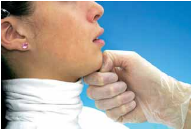
Abb. 5 Fingerknöchel-Grifftechnik nach ARNE LAURITZEN.

Fig. 5 Technique de prise selon ARNE LAURITZEN avec appui des joints articulaires des doigts.