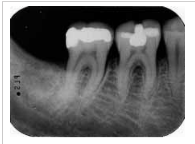
Abb. 3 Prämortale Röntgenbilder des Ober- und Unterkiefers rechts (Stand 1993)