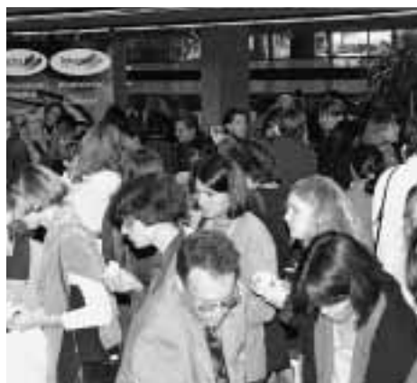
Der DH-Kongress ist eine ideale Kommunikationsplattform zwischen Dentalindustrie und der DH.