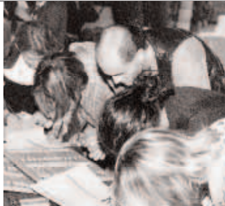
Emanzipation unter den Dentalhygienikerinnen