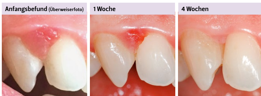
Abb. 5 Ausgeprägte lokalisierte Schwellung bei einer schwangeren Patientin (Verdachtsdiagnose Schwangerschafts-Epulis). Auch hier konnte erstinstanzlich rein durch ein Mundhygiene-Intensivprogramm eine Resolution rein nicht chirurgisch präventiv erreicht werden. Natürlich ist dafür in jedem Fall eine optimale Mitarbeit der Patientin unerlässlich.