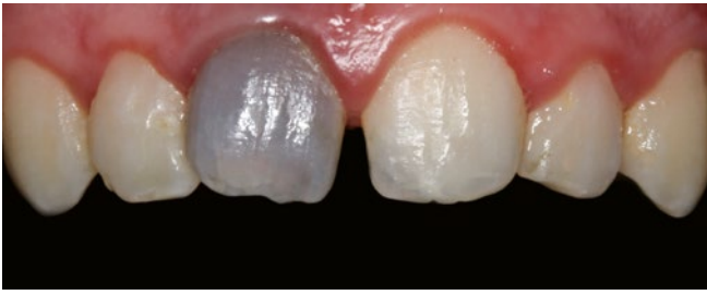
Fig. 2 Situation clinique initiale de la dent 11