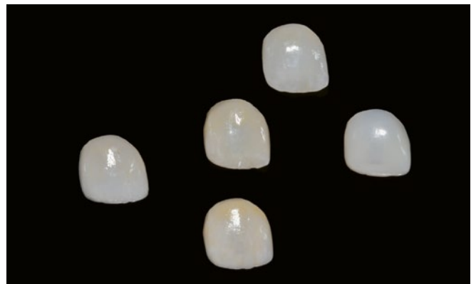
Fig. 6 Facette 11 à 360° réalisée avec cinq matériaux différents : à droite : composite indirect (Grandio blocs LT, VOCO); au milieu : vitrocéramique renforcée de leucite (IPS Empress CAD LT, Ivoclar Vivadent); à gauche : céramique de zirconie avec 5 % molaire d'oxyde d'yttrium (VITA YZ XT Multicolor LT, VITA Zahnfabrik); en haut : céramique de disilicate de lithium (IPS e.max LT, Ivoclar Vivadent); en bas : céramique feldspathique (VITABLOCS Mark II LT, VITA Zahnfabrik)

Lors d'un entretien de consultation, les différentes options de restauration ont été discutées et la situation initiale a été documentée à l'aide de photographies et de modèles. La lésion carieuse de la dent 11 a été éliminée en phase préprothétique, avec restauration directe en composite (Ceram X duo, Dentsply DeTrey GmbH, Constance, Allemagne). Puis un blanchiment interne de la dent 11 a été effectué à l'aide d'un insert à base de peroxyde d'hydrogène (Opalescence Endo, Ultradent Products GmbH, Cologne, Allemagne) (fig. 4). Après trois jours, l'insert a été changé et laissé en place pendant trois jours supplémentaires, soit un total de six jours. Ce prétraitement n'ayant pas permis d'obtenir un résultat esthétique totalement satisfaisant, il a été convenu, lors d'un entretien entre le patient et l'équipe soignante, de procéder à une restauration prothétique de la dent 11 afin de compenser les différences de teinte existantes (fig. 5).