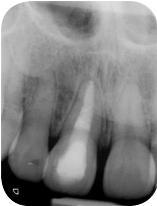
Fig. 3 Situation radiologique initiale de la dent 11, avec traitement canalaire achevé