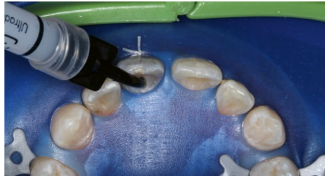
Fig. 4 Blanchiment interne de la dent 11