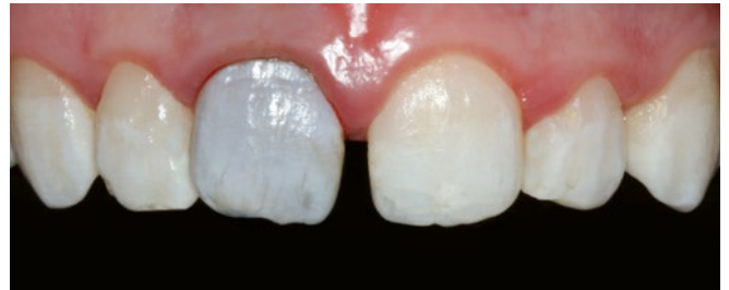
Fig. 5 Résultat final du blanchiment interne effectué sur la dent 11