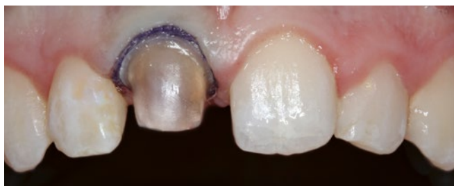
Fig. 7 Préparation de la dent 11 pour recevoir une couronne complète

Lors d'une première séance, la préparation pour facettes à 360° a été effectuée avec une ablation circulaire de 0,9 mm maximum, vérifiée initialement à l'aide d'un marqueur de profondeur et en continu avec une clé en silicone. Un fil de rétraction (taille 0, Ultrapak cleancut, Ultradent, Brunthal, Allemagne) a été placé ensuite et une empreinte de précision (empreinte de correction) a été réalisée avec une silicone à polymérisation par addition (Aquisil Ultra+ Soft Putty et Aquisil Ultra XLV, Dentsply Sirona). Une restauration temporaire (Luxatemp, DMG Chemisch-Pharmazeutische Fabrik GmbH, Hambourg, Allemagne) a été réalisée en utilisant la méthode directe pour vérifier l'épaisseur de la couche circulaire, puis incorporée à la fin du traitement avec un ciment de scellement temporaire sans eugénol (Temp-Bond clear, Kerr GmbH, Bioggio, Suisse). La teinte de la dent a été déterminée avec le prothésiste dentaire concerné (teinte du moignon à l'aide d'IPS NATURAL, Ivoclar Vivadent; teinte de la dent à l'aide de l'anneau de teinte VITA classique, VITA Zahnfabrik). Dans le cadre de l'essai des restaurations, une pâte d'essai de teinte dentaire (Variolink Esthetic - Try-In-Paste, Ivoclar Vivadent) a été utilisée pour simuler l'effet d'un matériau de collage sur l'aspect esthétique.