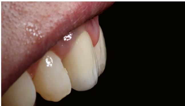
Fig. 9 Photo finale après scellement adhésif (RelyX Unicem) de la couronne personnalisée en dioxyde de zirconium (armature: Sirona inCoris ZI - F2, Dentsply Sirona; facette: IPS e.max Ceram, Ivoclar Vivadent)

En dehors d'une unité de conception et de fraisage, aucun équipement de laboratoire supplémentaire n'est nécessaire pour les composites indirects. Les restaurations constituées de ces matériaux peuvent être réalisées au fauteuil, en peu de temps et sans grandes contraintes techniques. À la différence des alternatives céramiques, l'individualisation peut être réalisée à l'aide de teintures ou de nuances de glaçage photopolymérisables (RAUCH & GOLD 2018).