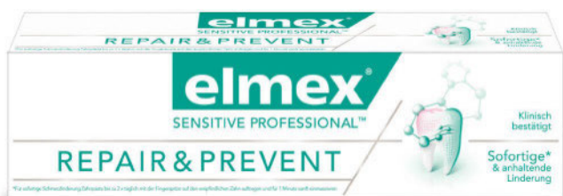
elmex® SENSITIVE PROFESSIONAL™ Repair&Prevent Zahnpasta mit PRO-ARGIN™-Technologie

In dieser Rubrik erscheinen Firmenpublikationen über neue Produkte, Verfahren und Dienstleistungen. Die Texte sind von den Firmen verfasst und liegen bezüglich der materiellen Substanz in deren Verantwortungsbereich.