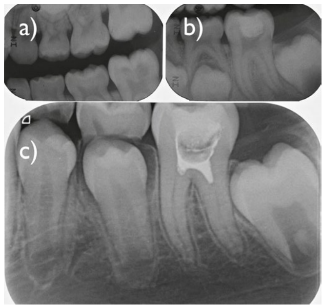
Abb. 2 a) 8-jährige Patientin mit fortgeschrittener Dentinläsion am Zahn 36 (Bitewing-Aufnahme links, Ausgangssituation). b) Situation nach Exkavation, Überkappung mit einem Kalziumhydroxid-Liner (Kerr Life; Kerr) und einer Glasionomerzementfüllung. Das Wurzelwachstum des Zahnes ist zu diesem Zeitpunkt nicht abgeschlossen (Einzelzahnrontgenaufnahme einen Monat nach Ausgangssituation). Infolge starker postoperativer Schmerzen wurde wenige Tage später eine Pulpenkammer-Pulpotomie durchgeführt. Die Dentinwunde wurde mit einem Kalziumhydroxid/Jodoform-Präparat (Vitapex; Neo Dental International Inc.) abgedeckt und der Zahn erneut provisorisch verschlossen. c) Beschwerdefreie Verhältnisse während rund 17 Monaten, dann (zum Zeitpunkt dieser Aufnahme) Auftreten von Schmerzen auf Kälte und Wärme sowie Perkussionsempfindlichkeit. Die entsprechende Einzelzahnrontgenaufnahme zeigt, dass das Wurzelwachstum nun abgeschlossen ist. Allerdings ist es auch zu einer markanten Verengung der Wurzelkanäle und einer Sklerosierung der Kanaleingänge gekommen, welche die Durchführung der nun indizierten Pulpektomie beim Kind mit eingeschränkter Mundöffnung zusätzlich erschwert.

Wenn man die zahlreichen Studien zur Versorgung von tief kariösen Dentinläsionen durchforstet, findet man kaum Hinweise darauf, dass Pulpaobliterationen eine häufige Komplikation darstellen. Der klinische Alltag eines Endodontologen zeigt aber ein anderes Bild (Abb. 2). Während die einen Autoren die reparative Dentinbildung als Folge von vorangegangenen pathologischen Veränderungen sehen (REEVES & STANLEY 1966), glauben andere, dass es sich dabei um einen potenziell nützlichen Effekt der Pulparegeneration handelt (GOLDBERG ET AL. 2008) und ein konservatives Therapieverfahren trotz erheblicher Pulpaentzündung zu einer günstigen Prognose führen kann (GRUYTHUYSEN ET AL. 2010). Zu diesem Thema fehlt es eindeutig an Langzeitstudien am Menschen. Bevor solche Daten existie-