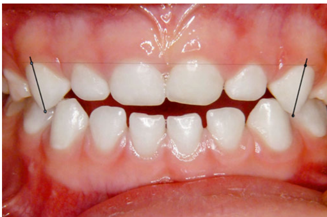
Abb. 7 Der offene Biss hat sich nach fünf Monaten auf 2 mm verkleinert. Eine transversale Vergrößerung und Aufrichtung der Zähne 53 und 63 ist zu beobachten.