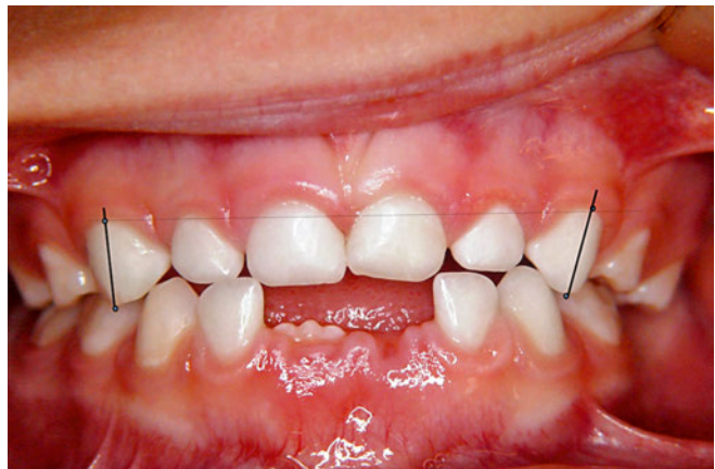
Abb. 8 Fall 1: Nach neun Monaten zeigte sich ein regulärer Überbiss (frontale Ansicht), und ein transversales Wachstum ...