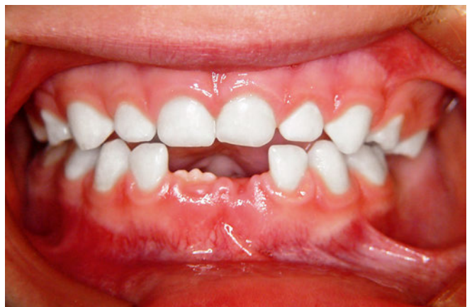
Abb. 9 ... und beim Schlucken geht die Zungenspitze deutlich zur Papilla incisa. Das Schluckmuster hat sich vom viszeralen zum adulten Schlucken verändert. In diesem Moment des Schluckens befindet sich die Okklusion nicht in maximalem Seitenzahnkontakt.

wöhnen des Schnullers nach der Behandlungszeit von neun Monaten stellte kein Problem dar.