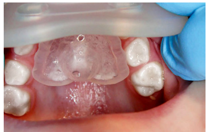
Abb. 5 Fall 1: Curaprox-Schnuller Grösse 2 vor Behandlungsbeginn in situ