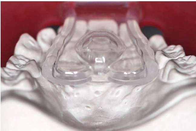
Abb. 2 Schnuller am Modell: passive Lage des neuartigen Schnullers im Mund

Eine kariesaktive Patientin stellte sich im Alter von vier Jahren und zwei Monaten mit offenem Biss in der Schulzahnklinik Basel vor. Sie benutzte noch immer die Baby Bottle (in der Nacht, aber auch zum Trösten), zeigte sehr viel Plaque, und der Schnuller (Nuggi) war ihr vor Kurzem abgewöhnt worden. Morphologisch und funktionell zeigte sie einen ausgeprägten offenen Biss von 7 mm mit Mundatmung (die Milchmolaren hatten okklusalen Kontakt, Zahn 75 fehlte) und ein persistierendes infantiles Schluckmuster (Zungenstoss) während des Schluckens (Abb. 4). Therapeutisch wurde nicht nur das Zähneputzen intensiviert, sondern auch die Baby Bottle in der Nacht gegen den Curaprox-Schnuller (Curaden, Dietikon, Schweiz, Grösse 2) ausgetauscht (Abb. 5). Eine weitere funktionelle Therapie erfolgte nicht. Im Recall zeigte sich nach sechs Wochen eine Reduktion des offenen Bisses auf 5 mm (Abb. 6), nach fünf Monaten auf 2 mm (Abb. 7) und nach neun Monaten war der Überbiss regulär und die Mundhygiene hatte sich deutlich verbessert (Abb. 8). Auch das Schluckmuster hat sich vom viszeralen zum adulten Schlucken verändert (Abb. 9). Die Akzeptanz gegenüber dem neuen Schnuller bei Eltern und Kind war während der gesamten Behandlungszeit gegeben. Die Umstellung von der Baby Bottle auf den Schnuller erfolgte problemlos. Das Abge-