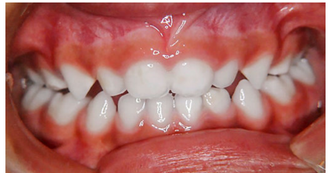
Abb. 14 Fall 3 nach dreimonatiger Therapie: geschlossener Biss, die 2. Milchmolaren sind durchgebrochen