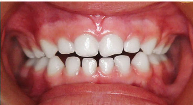
Abb. 11 Fall 2: Reduktion des offenen Bisses drei Monate nach Behandlungsbeginn sowie Korrektur von Kopf- bzw. Kreuzbiss der Milchzähne