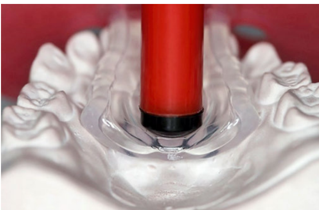
Abb. 3 Schnuller am Modell: Der Druck der Zunge auf die Halbkugel in der Mitte des Schnullers übt eine transversale Kraft auf den Oberkiefer aus.