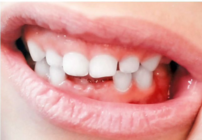
Abb. 12 Fall 2: normaler Overbite der Milchfrontzähne bei begunnenem Zahnwechsel nach insgesamt zweijähriger Benutzung (Bild der Eltern, die in die Türkei umgezogen sind).

in regulärem Überbiss befinden. Die Abgabe des Schnullers nach Ende der Behandlung stellte kein Problem dar.