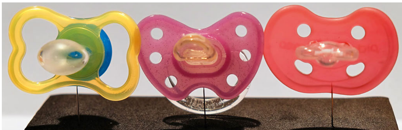
Abb. 1 Schnuller im Vergleich: jeweils grösste Grösse von links nach rechts, Beispiel einer üblichen Morphologie MAM (Fa. BAMED AG, Wollerau, Schweiz), modifizierter Morphologie Dentistar (Fa. Novatex, Patten, Deutschland), neuartige Morphologie Curaprox (Fa. Curaden, Dietikon, Schweiz)

In den nachfolgend ausgewählten Fällen wurde davon ausgegangen, dass eine Wirksamkeit der Druckverteilung nicht nur