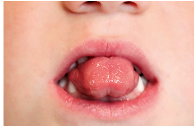
Abb. 4 Ausgangssituation Fall 1 vor Behandlungsbeginn (frontale Ansicht)