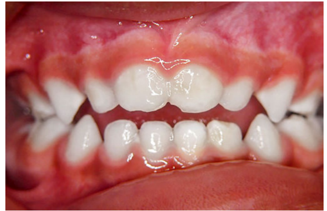
Abb. 13 Ausgangssituation Fall 3 vor Behandlungsbeginn im Alter von zwei Jahren und fünf Monaten (frontale Ansicht): frontal offener Biss sowie Kopfbiss der 1. Milchmolaren