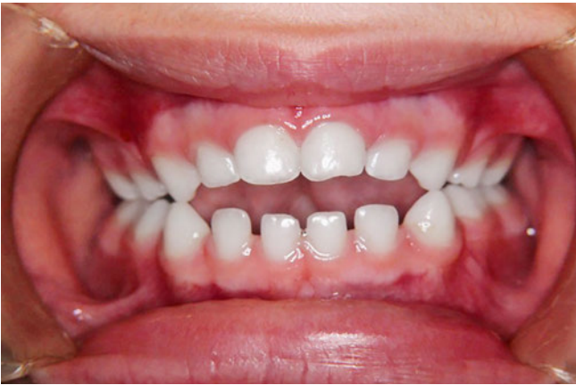
Abb. 10 Ausgangssituation Fall 2 vor Behandlungsbeginn im Alter von vier Jahren und sechs Monaten (frontale Ansicht): offener Biss mit Kopfbiss der Zähne 53 und 83 und Kreuzbiss der Zähne 63 und 73