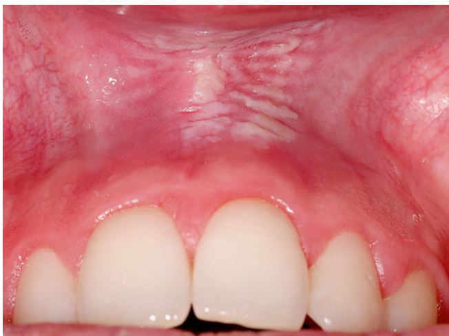
Fig. 3 Leucoplasie orale chez un homme de 29 ans sur le site d'application du snus dans le vestibule antérieur du maxillaire

Dans le cadre d'une étude approfondie publiée en 2008, Ann Roosaar et coll. ont investigué de 1973 à 2003 une cohorte de