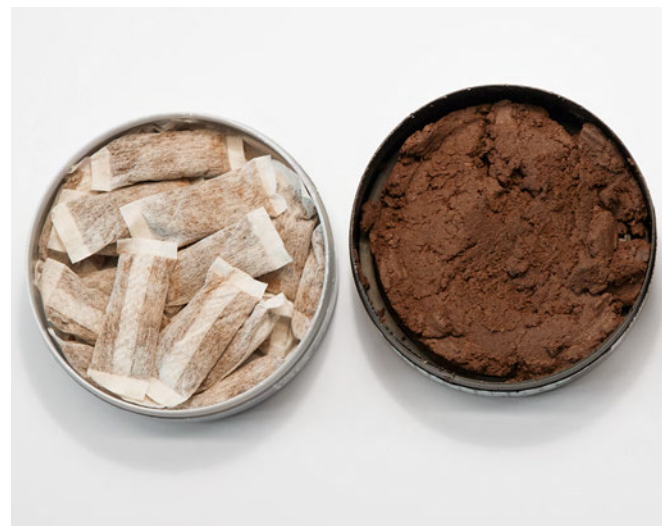
Fig. 1 Les différentes formes de snus, en sachets et en vrac. Ces produits tabagiques sont maintenus humides dans des boîtes en plastiques étanches à l'air.

Øverland et coll. (2013) ont investigué dans un collectif de 25 163 personnes les relations entre la consommation de snus suédois et les facteurs de risque cardiovasculaires, et ils ont comparé les résultats obtenus avec ceux des fumeurs. Outre la mesure de la pression artérielle, les taux de triglycérides, de glucose, de lipoprotéines de haute densité (HDL) et de cholestérol total ont été déterminés. Chez les sujets consommant régulièrement du snus, une association positive a été rapportée avec une augmentation de la pression artérielle systolique (jusqu'à 130,1 mmHg) et du taux de cholestérol HDL (ØVERLAND ET COLL.